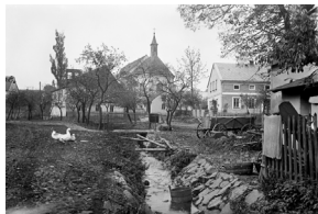
• centrum (kol. 1915) - kostel a č. 8

Fungoval tu Obecní úřad (1676 - 1945) s archivem (1843 - 1945); urbaniální soupis (1676), kniha obecního soudu, soupisy obyvatel (1742 - 77 a 1780), pozemků s výnosy (1745), robotní seznam 1777, parcelní protokol (1843), seznamy narozených, sňatků a úmrtí (1850 - 64), obyvatel (1850 - 1921), pamětní kniha (1924 - 40), zápisy zastupitelstva (1910 - 36), rozpočty (1926 - 43); obecná škola