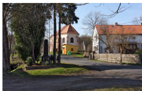
• čtvrtěk 8. 4. 2010