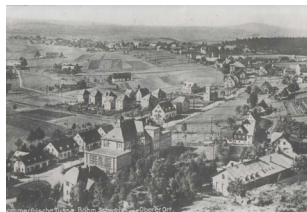
• Letní Tisá (horní partie) - České Švýcarsko (Böhmische Schweiz) - pohled na školu, Vřesoviště (Heide) a Lada (peterswald.org)

Lada (Brache) - 575 m n. m. - Původně osada při tvrzi Šenov (Schönstein, Schönhof, Schenau) děčínských Vartenberků střeživší Starou solnou stezku (Via Salaria, Alte Salzstraße) vedoucí ze srbského hradu Neleticů Dobré Hory (Dobrohora, Dobrogora) - dnes Halle (Dolnosol, Hála Magdeburská) - přes lázně Gottleuba, Hladov (Hungertuch), Nový Dvůr (Neuhof) Antonínov (Antonsthal) a Lada; za Cihlářským rybníkem (Ziegelteich) pokračovala do Horního Libouchce (Oberkönigswald, Holzgrund, Tschekenthal), Malého Chvojna (Kleinkahn), Žďáru (Saara), Strážek (Troschig, Troschik), Božtěšic (Postitz), odtud po Skrivánčím vrchu (Lerchenfeld) přes Ústí Středohořím do Prahy. Na dlážděné cestě bývaly prý patrné rýhy od kol formanských vozů.