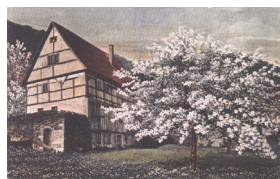
• Dosud existující dům patřící k nejstarším v Sebusíně se nachází v Kolibově, dodnes slouží jako obytný.

Na pokrajích strmé Machy zřízen ochranný altánek. Vyhledka na protější vinorodé břehy Labské u Zálezly je rozkošná. Výcházka ze Sebusína přes Machu a Varhošť k vile patří rozhodně k nejrokošnějším a nejpříjemnějším v Středohoří ... Jiný jižnější výběžek Babiny dosahuje ve Varhošti nejvyšší výšky (637 m) a končí se opět skálou Machou nad Labem