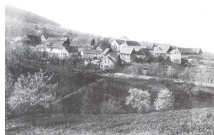
● pohled od severovýchodu (kol. 1920)

Kojetice (Kojeditz) - 318 - 325 m n. m. - Slovanská okrouhlice (z 9. - 10. stol.) Kojatových (Kojeticů) v horním úžlabí Kojetického potoka ( Bukowinkenbach, Wolfshlingerbach ), mezi Přední hůrkou ( Fibichberg ) (501,2 m) a vršky Kopané ( Kopane ) a Bukovina ( Bukowinka ). Figuruje (1088) ve falzu zakládacího dokumentu Královské kolegiální kapituly sv. Petra a Pavla na Vyšehradě ustavené kol. r. 1070 knížetem (28. 1. 1061 - ? . 4. 1085) Vratislavem II. (* 1032/35 - † 14. 1. 1092), posléze prvním českým králem (do 14. 1. 1092) z rodu Přemyslovců (Vratislav I.). Další podvrh je kladen do l. 1142 - 78.