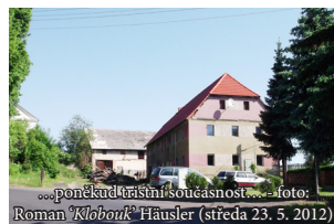
poněkud trštiní současnost...