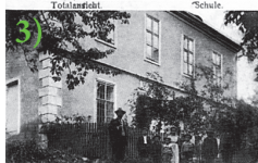
Gruss aus Tschersing.